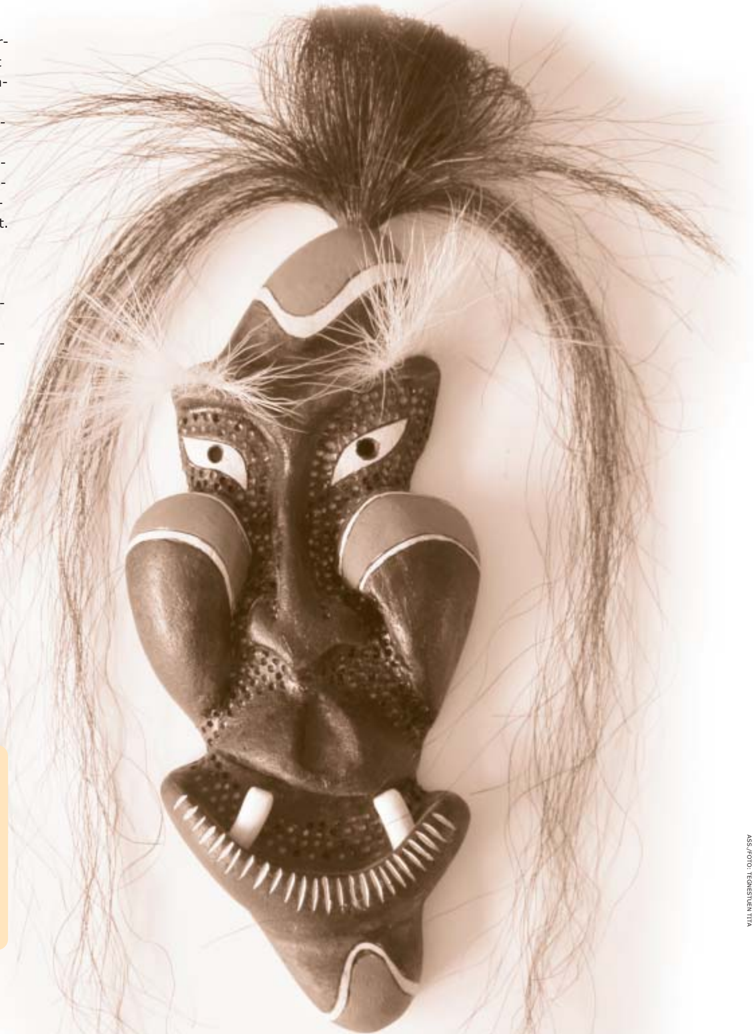
ASS./FOTO: TEGNESTUEN TITA

Peqqussut www.nanoq.gl -imi takuneqarsinnaavoq. Inatsisiliornerup ataani takuneqarsinnaavoq.